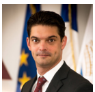
Jérôme VIAUD Président du Pays de Grasse, Maire de Grasse.

A la fois ludique, incitatif et pédagogique, le système donne envie aux petits et grands de trier par son côté interactif. L'application mobile offre la possibilité de connaître l'économie en CO 2 réalisée par son geste de tri.