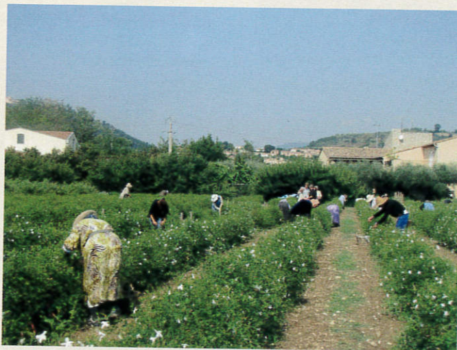
Cueillette de fleurs de jasmin dans la région de Grasse.

le comité de l'Unesco réuni à Port-Louis, capitale de l'Île Maurice, en novembre dernier. Comme le souligne l'agroécologiste Pierre Rabhi, président d'honneur de l'association Patrimoine Vivant du Pays de Grasse , « Sauvegarder cette culture, c'est aussi sauvegarder un terroir, un territoire, un pays, des paysages, des paysans. » Ce succès fait la fierté des Grassois, il couronne un savoir-faire inscrit dans les traditions et le patrimoine de la cité. Il va également dynamiser une industrie locale, avec des retombées économiques que l'on souhaite conséquentes pour tout un territoire. Gageons que cette reconnaissance officielle de l'Unesco ne manquera pas d'encourager les initiatives pour la reconnaissance d'autres éléments du patrimoine immatériel de la Provence.